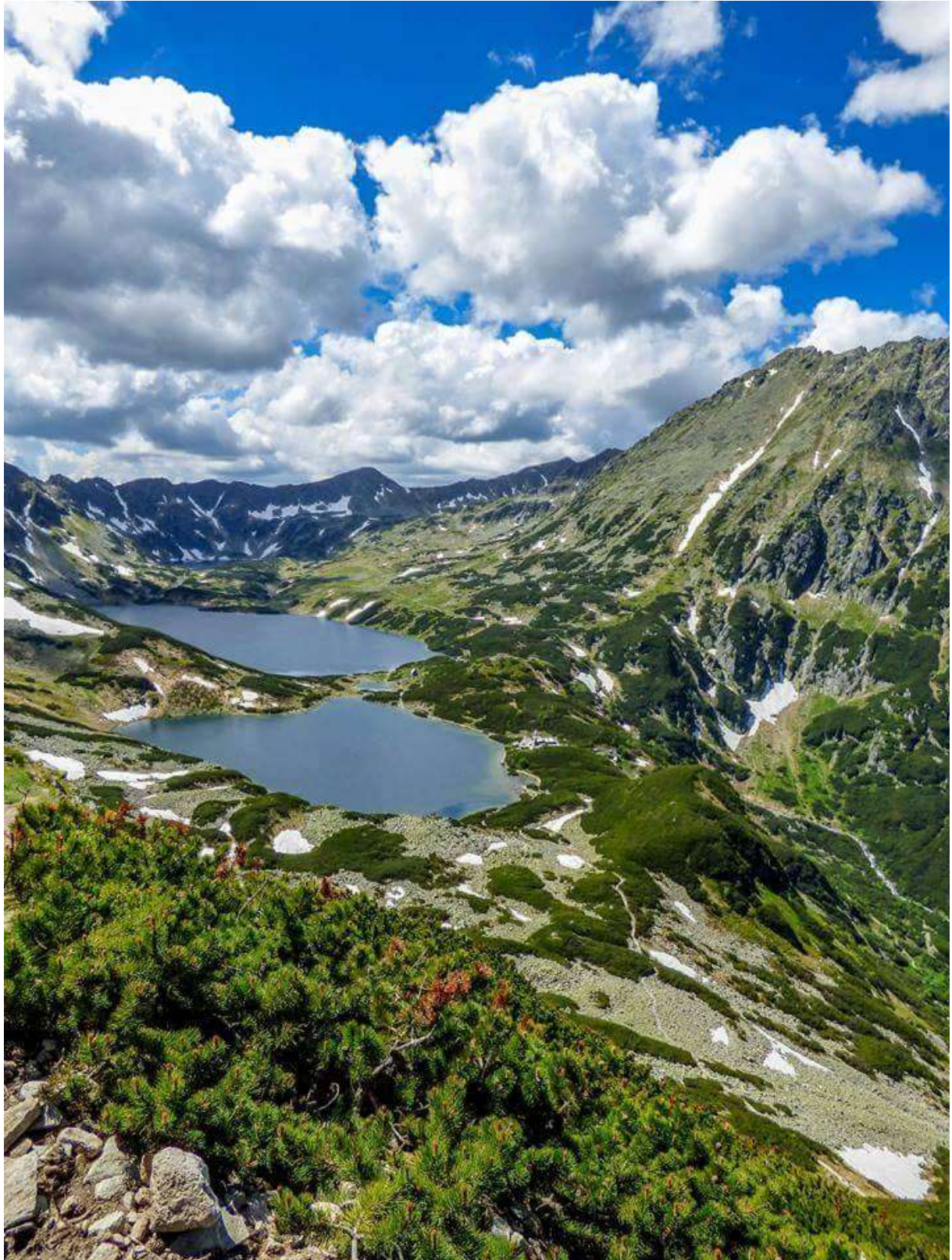
Dolina Pięciu Stawów – Tatry