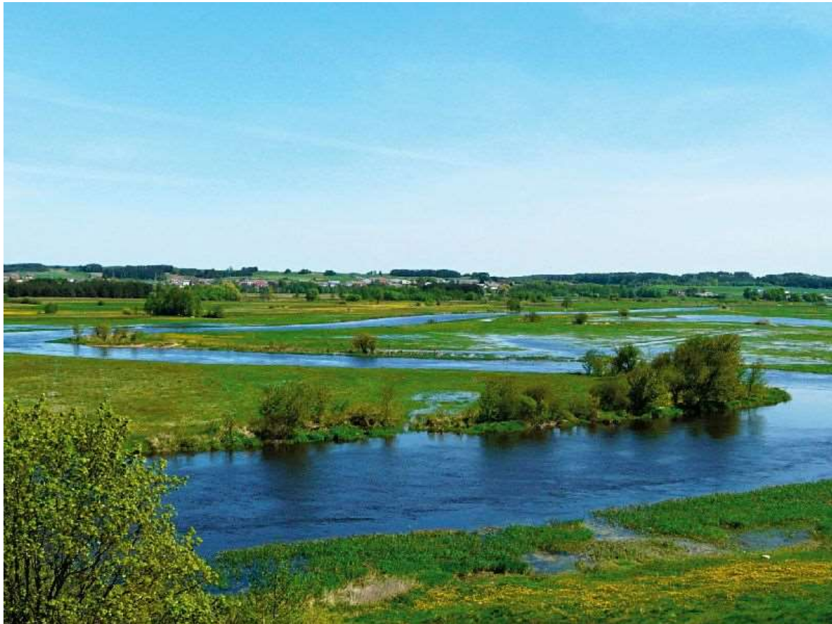
Biebrza - Podlasie