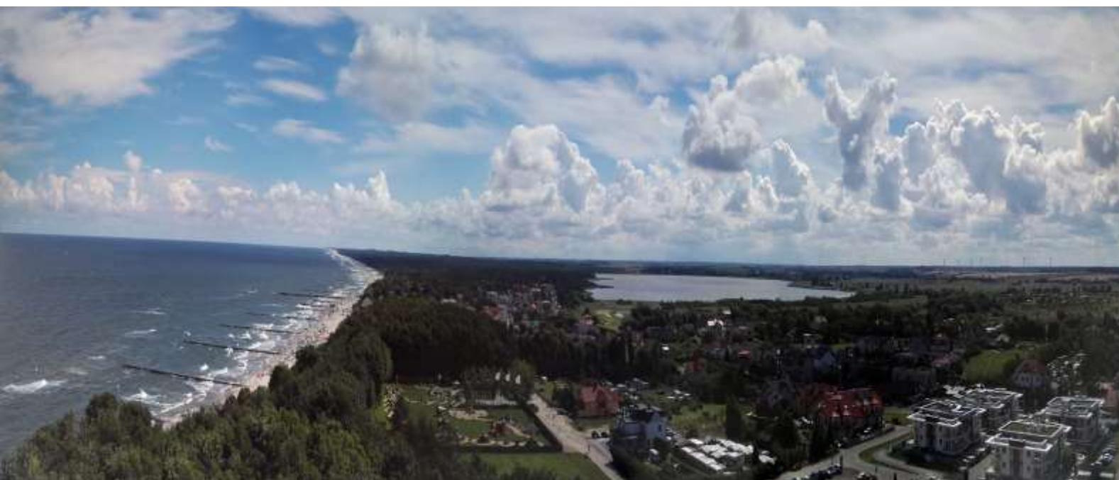
Pobrzeża z jeziorem przybrzeżnym