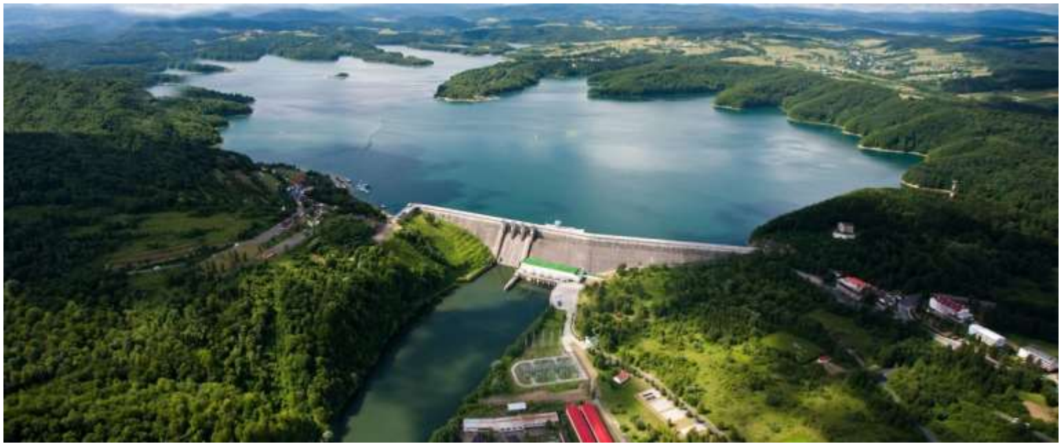
Solina elektrownia wodna