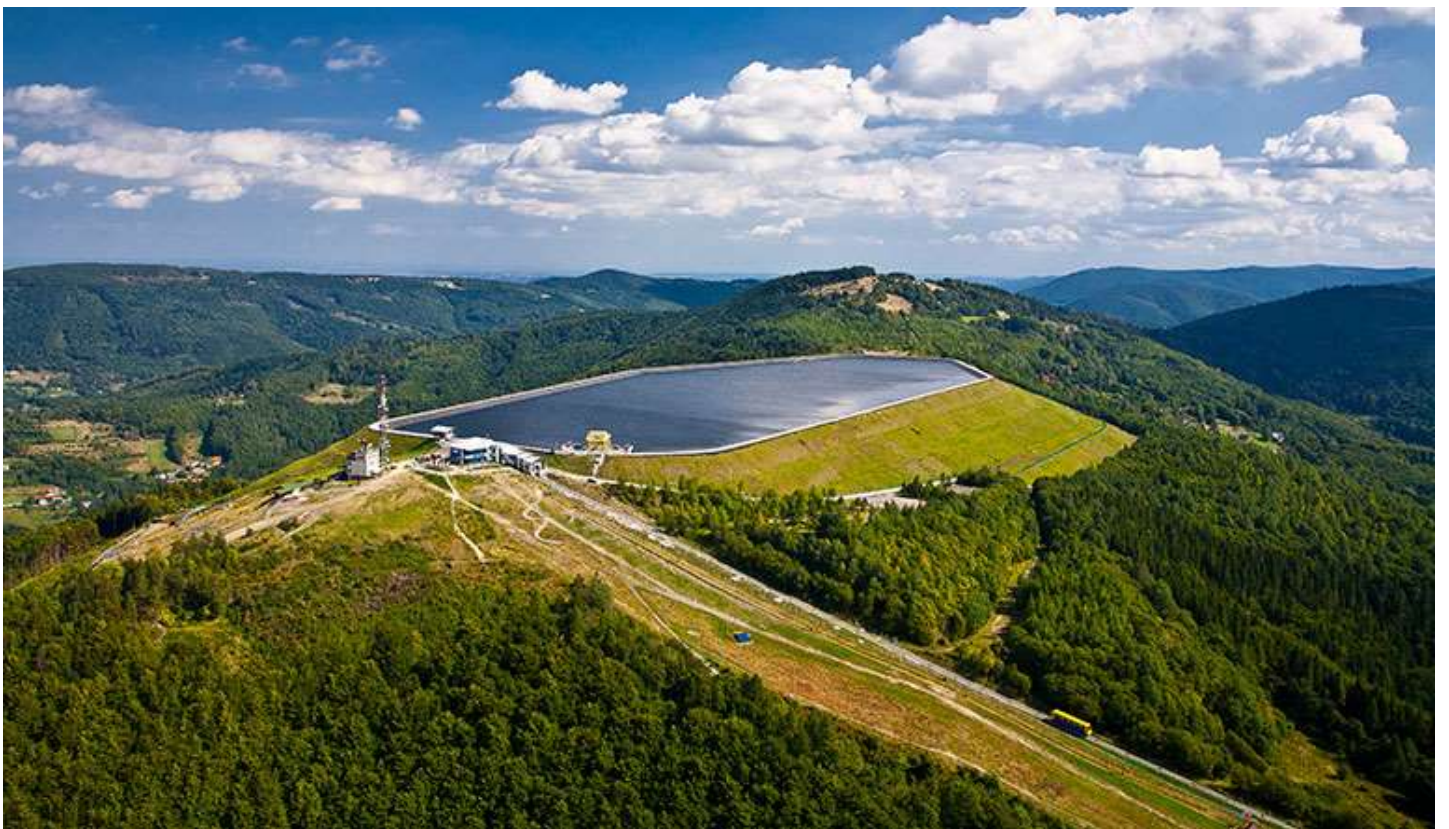
Porąbka Żar – elektrownia wodna