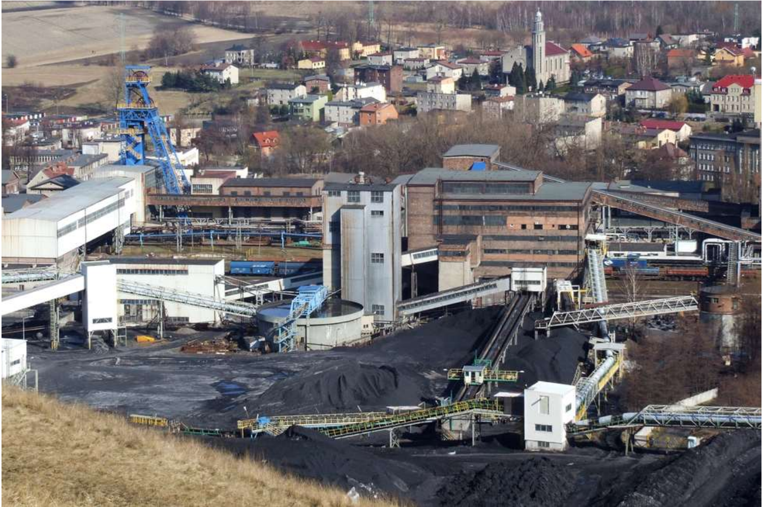
Krajobraz antropogeniczny Śląsk