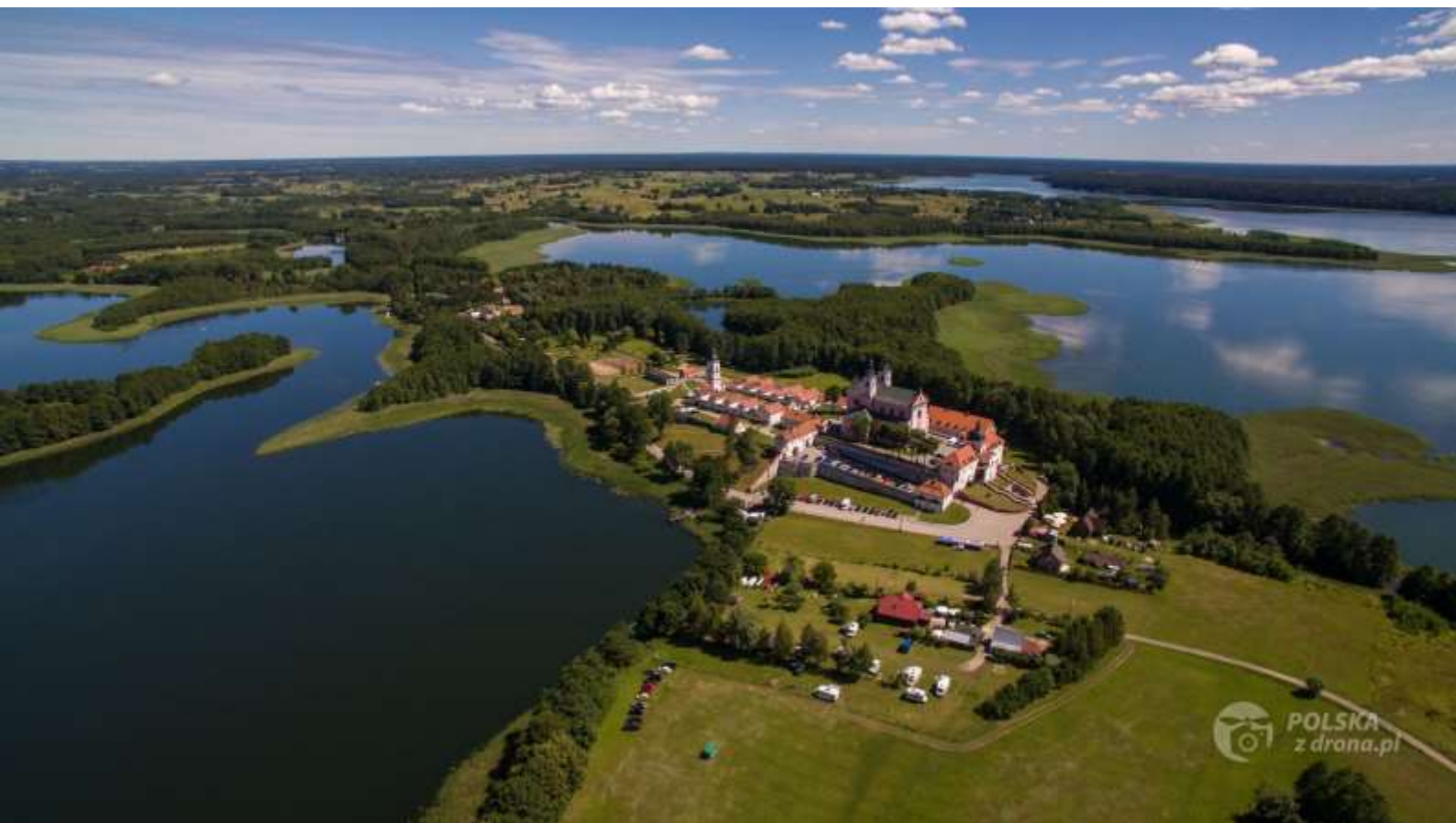
Wigry – klasztor