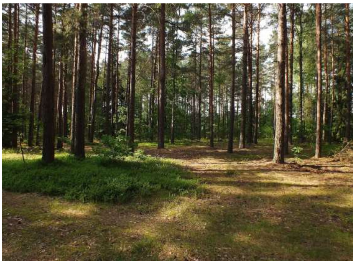
Bory Tucholskie – jeden z największych kompleksów borów sosnowych w Polsce. Zajmuje ok. 3 tys. km 2 sandru w dorzeczu Brdy i Wdy oraz Równiny Tucholskiej.