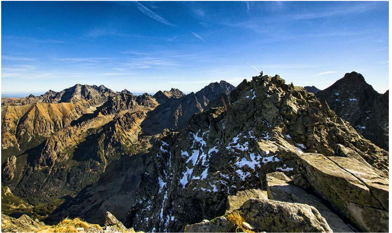
Tatry – Rysy