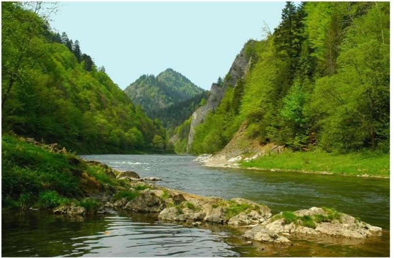
Pieniny – Dunajec