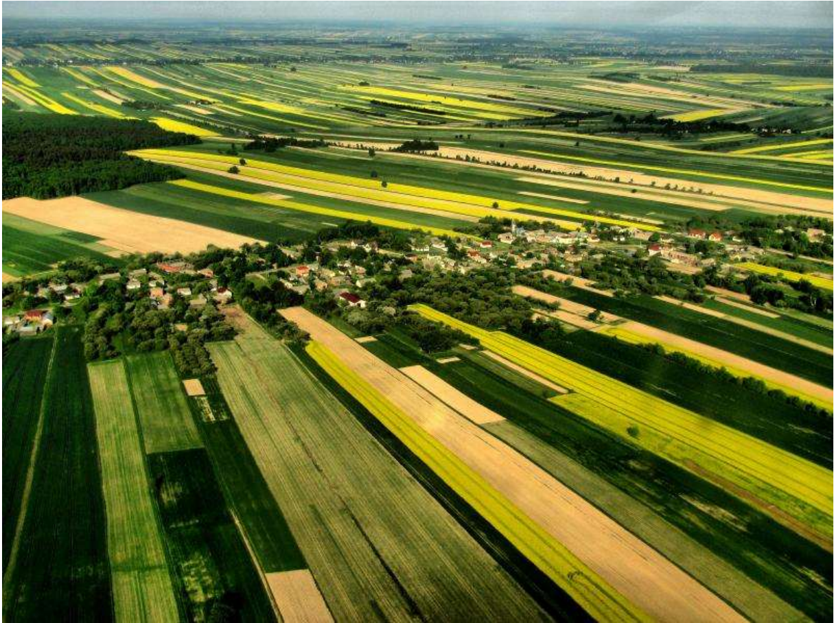
Rolniczy krajobraz Wyżyny Lubelskiej